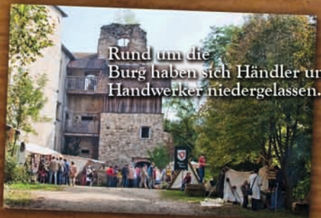
Rund um die Burg haben sich Händler und Handwerker niedergelassen.