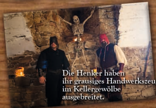
Die Henker haben ihr grausiges Handwerkszeug im Kellergewölbe ausgebreitet.