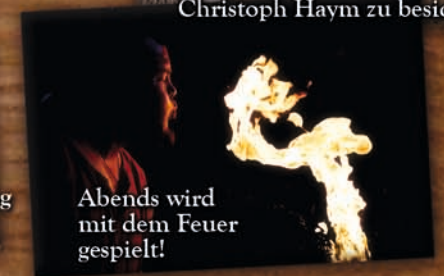
Abends wird mit dem Feuer gespielt!