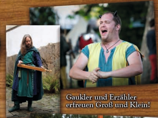
Gaukler und Erzähler erfreuen Groß und Klein!