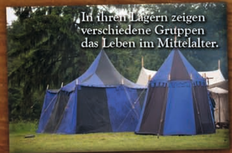
In ihren Lagern zeigen verschiedene Gruppen das Leben im Mittelalter.

Zu den Museumsführungen muß man sich aufgrund begrenzter Teilnehmeranzahl an der Kasse anmelden.