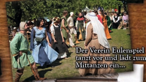
Der Verein Eulenspiel tanzt vor und lädt zum Mittanzen ein...