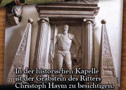
In der historischen Kapelle ist der Grabstein des Ritters Christoph Haym zu besichtigen.