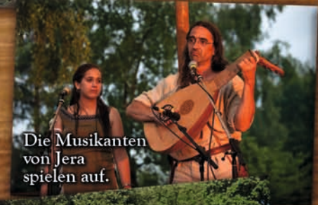
Die Musikanten von Jera spielen auf.